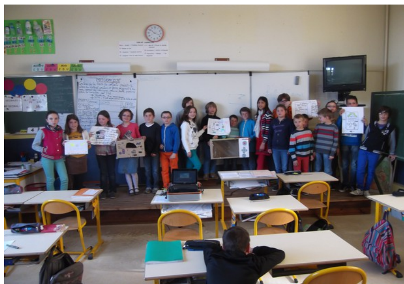
Les groupes et leur projet.