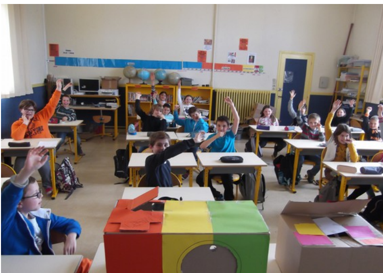
Le vote à main levée et la maquette de la future « Elec' tri box », au premier plan, qui a remporté l'unanimité. Elle perdra ses couleurs.