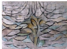
Mondrian, Pommier en fleurs , 1912, Huile sur toile, 78 x 106 cm, Gemeentemuseum, La Haye