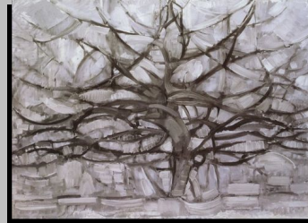
Mondrian, L'Arbre argenté , 1911, Huile sur toile, 78,5 x 107,5 cm, Gemeentemuseum, La Haye. (Musée Itinérant I.10)