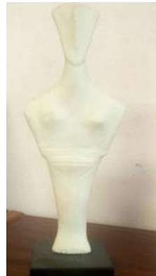
M16 – Idole féminine