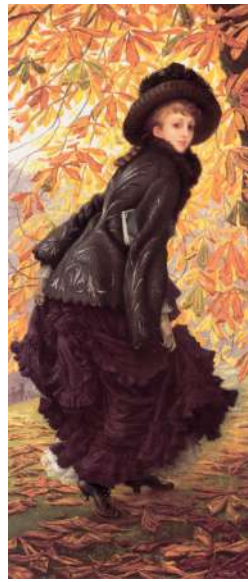
I.86 TISSOT Octobre