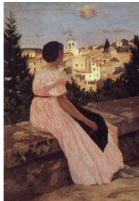
1 – BAZILLE La robe rose