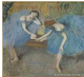
12 DEGAS Deux danseuses au repos