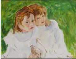
I.28 CASSAT Les soeurs