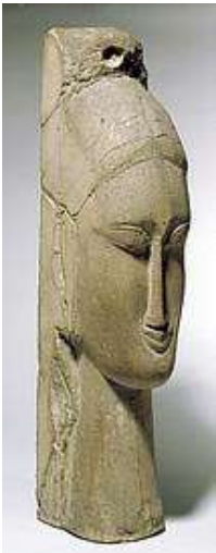
M1 - MODIGLIANI Tête de femme XXè