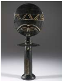
M5 – Poupée ashanti