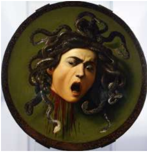
L19 LE CARAVAGE Tête de méduse