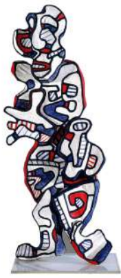
I.22 DUBUFFET Fiston la filoché