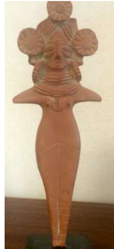
M13 – Déesse de l'Inde