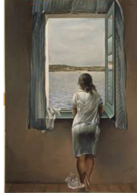
11 – DALI Jeune fille à la fenêtre