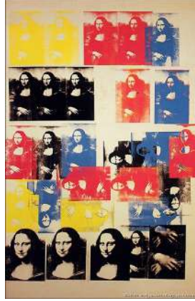
L73 WARHOL Mona Lisa