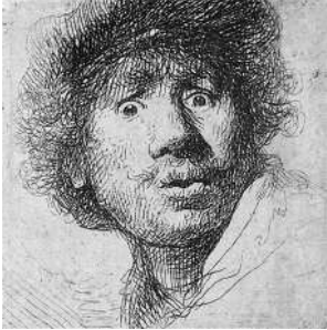
L5 REMBRANDT Portrait de l'artiste par lui-même