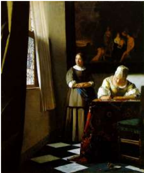
L39 VERMEER Jeune femme écrivant une lettre et sa servante