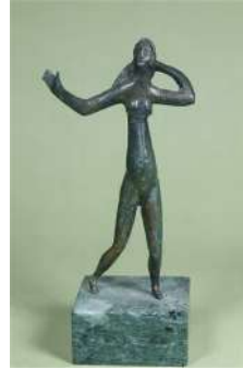
M3 – La danseuse