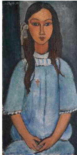
I.5 MODIGLIANI ALice