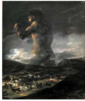
L23 – GOYA Le colosse