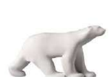
M – POMPON L'ours