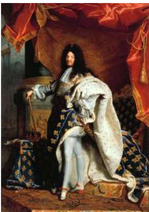
L7 RIGAUT Louis XIV en costume de sacre