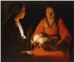
I.94 DE LA TOUR Le nouvea-né