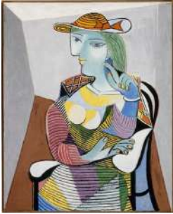
I.7 PICASSO Portrait de Marie-Thérèse