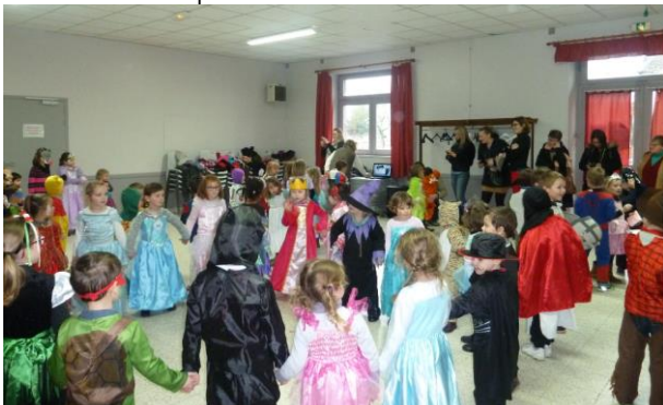
Les enfants font une ronde au bal costumé.

Les enfants se sont déguisés avec leurs costumes. Les adultes ont maquillés ceux qui le souhaitent. Une fois déguisés, les trois classes de Fleury sont allées à la salle des fêtes pour danser et défiler. Il y avait des reines des neiges, des princesses, des animaux, des supers héros, des chevaliers et des méchants. Ensuite, nous sommes allés dans la cour lancer des confettis et manger des crêpes confectionnées par les mamans.