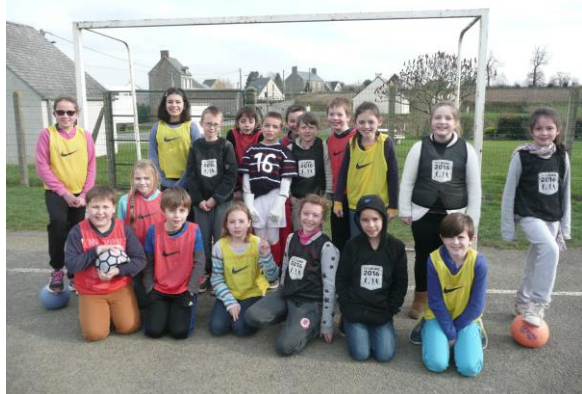
Les élèves en footballeurs avec notre Super Victor, la mascotte de l'Euro 2016.

Nous avons fait le concours « Mon Euro 2016 ». Beaucoup d'écoles de France y ont participé. On devait faire une vidéo, une chanson, une affiche, une danse ou un texte sur le thème « Quand l'Europe et le football se rencontrent ». Nous avons choisi de faire une vidéo. Nous avons inventé une histoire : la mascotte de l'Euro est triste car l'Euro 2012 est fini. Elle va donc partir inviter les 24 pays pour que l'Euro recommence...en France. La mascotte voyage dans chaque pays. Puis l'Euro commence, il y a des joueurs, les arbitres, les supporters... Notre vidéo a été envoyée au jury du département de la manche si elle est sélectionnée, elle sera envoyée à la Fédération Française de Football . Les écoles qui gagneront auront des places pour aller voir un match de l'Euro.