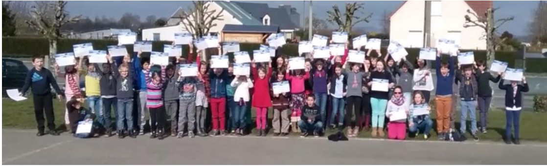
Les CE2 de La Bloutière