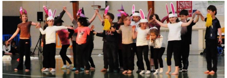
Classe des CP de Villedieu

Deux de ces textes parlaient d'une sorcière qui louche. Ce personnage a ensuite été tiré de ces histoires et retravaillé pour devenir le héros d'une danse, que nous avons présentée aux élèves de l'école, puis aux parents le 17 mai à la salle des Monts Havard.