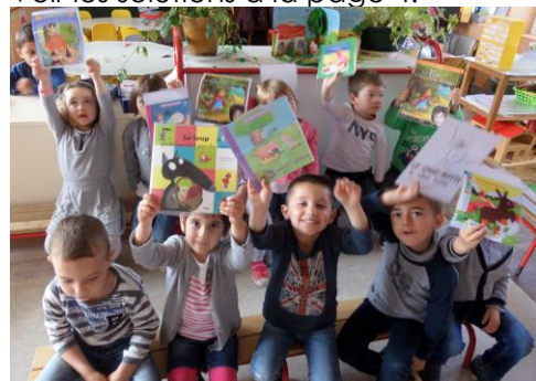
Classe de TPS/PS/MS de Fleury