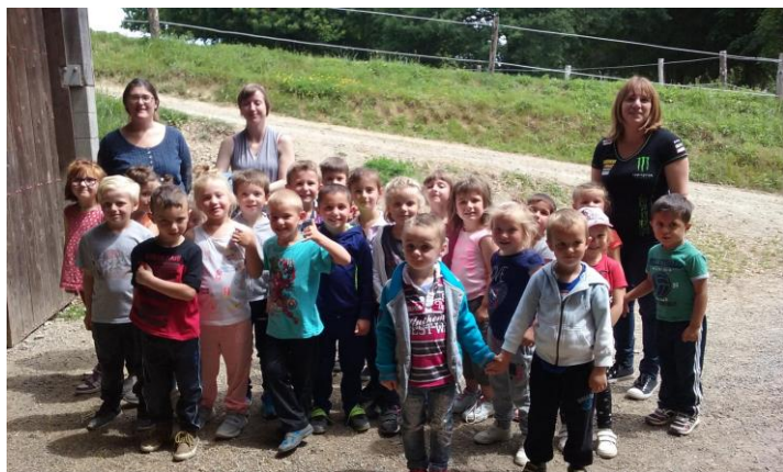
Les élèves de MS GS de Fleury

C'était génial, les poneys étaient coquins. Enfin nous sommes rentré dans le bus, certains étaient fatigués et se sont endormis avant d'arriver à l'école.