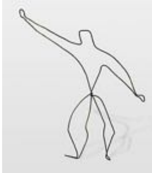
Le Lanceur de poids, 1929