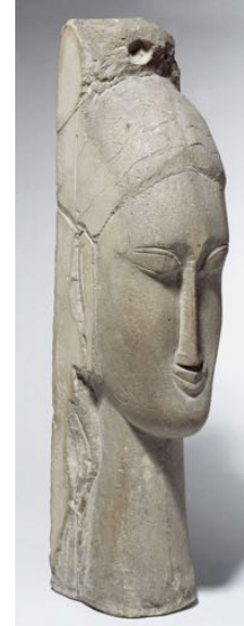
Tête de femme, 1912

Ce portrait de Miró a été réalisé deux ans après que Calder ait fait la connaissance du peintre espagnol. De cette rencontre naîtra une longue amitié entre les deux artistes. Comme pour les autres têtes en fil de fer, celle-ci donne l'impression d'avoir été faite d'un seul geste continu. Si l'on retrouve dans tous ces portraits l'humour et le trait de caricaturiste de Calder, le modèle sur lequel il s'appuie pour les concevoir est plus inattendu. De nombreux dessins préparatoires montrent qu'il s'est inspiré des portraits physiognomoniques du peintre français du 17 e siècle, Charles Le Brun, lequel déduisait des lignes et des proportions du visage humain le caractère de l'âme. L'emprunt à Le Brun de sa méthode de grossissement et de déformation des traits permet à Calder d'obtenir des têtes expressives, au relief marqué, malgré leurs volumes vides.