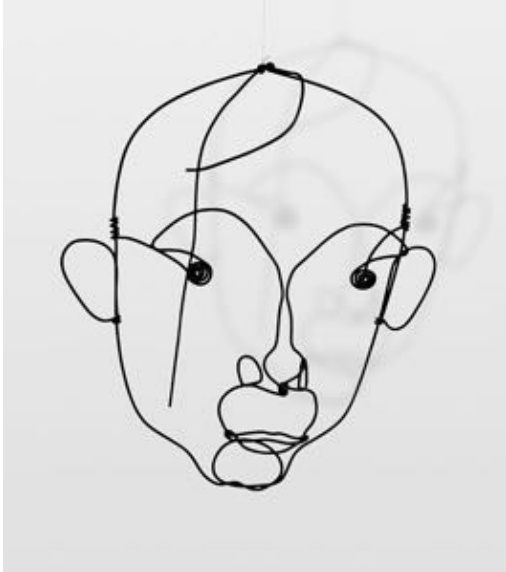
Portrait de Joan Miró, vers 1930